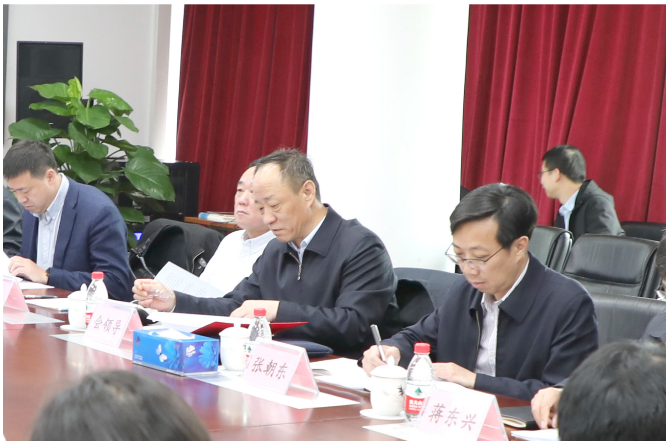
中国证监会党委委员、副主席赵争平同志来我公司调研指导科技监管工作。