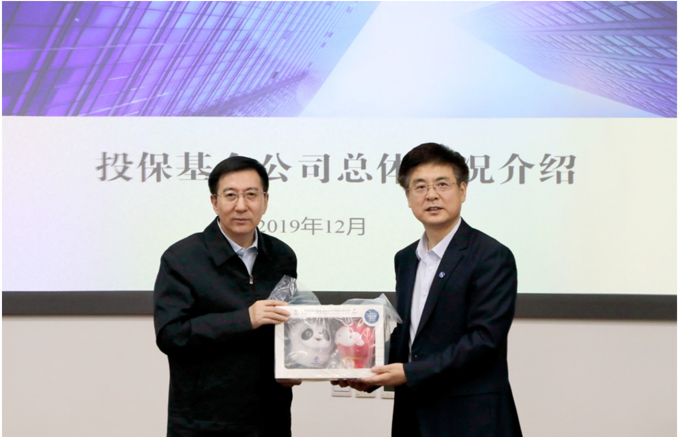
北京市副市长张建东一行来我公司调研座谈。